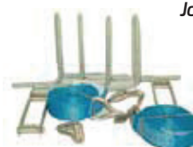
Förankringsband Modell 1