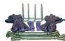
Förankringsband Modell 2-8