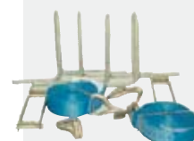
Förankringsband modell 1