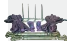
Förankringsband modell 2-8